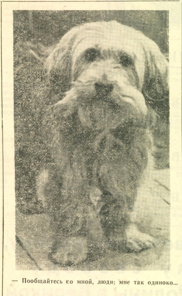
— Пообщайтесь со мной, люди: мне так одиноко...

Творческий поиск коллектива продолжается. г. Советская Гавань. Л. ГАЛКИНА.