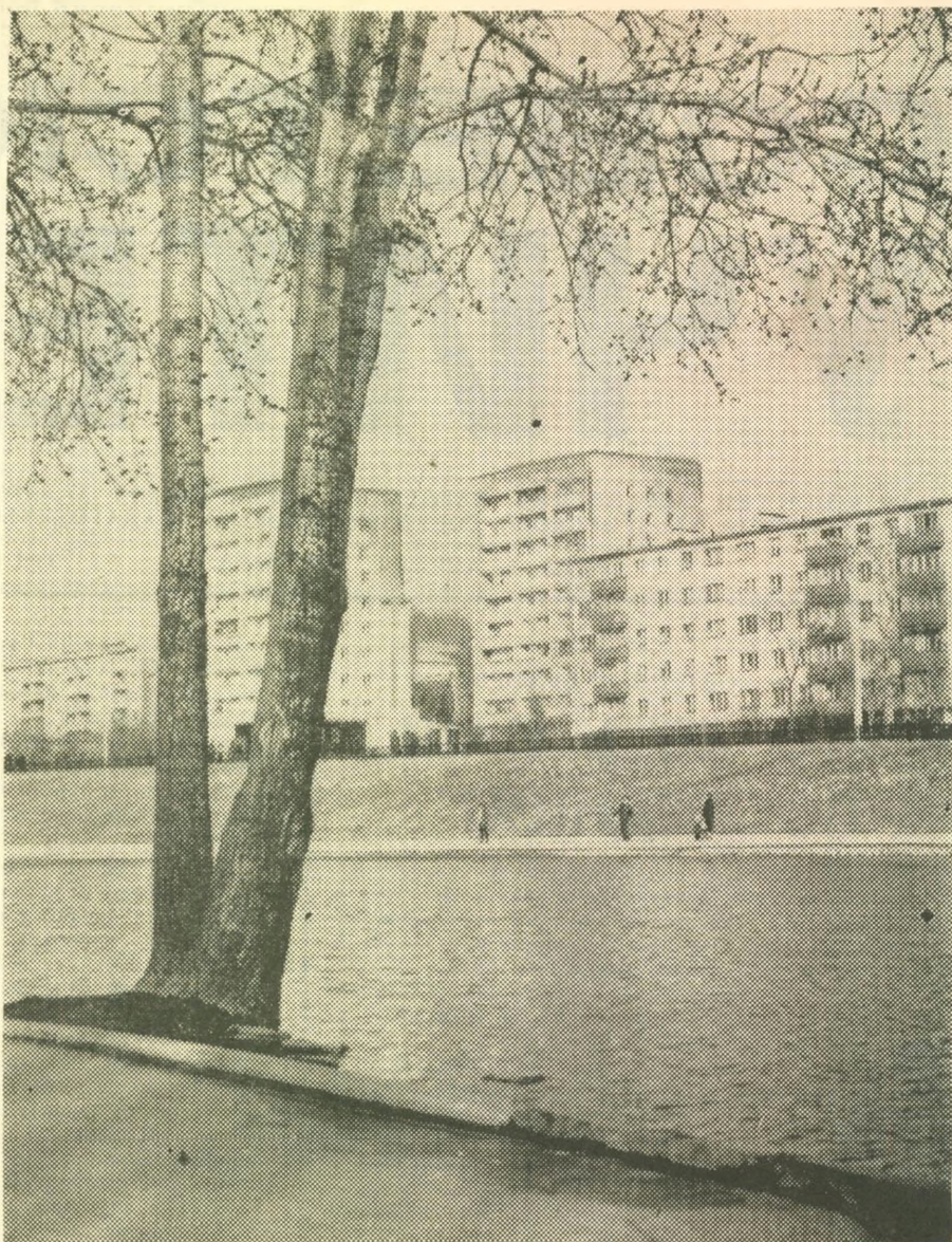
ВЕСНА НА ПРУДАХ...

Даны рекомендации по учету этих взаимоотношений в процессе подготовки и повышения квалификации учителей, преподавателей и студентов педагогических институтов. Стоимость пособия 75 копеек.