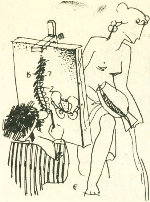
О вкусах не спорят.

Господи, ну кто же знал, что в институте надо учиться, а не радоваться жизни! Неужто прошли те времена, когда в учащих студентов тыкали пальцем и давали позорную кличку «отличник». Вот уже и сессия приближается, грех зачетками и оцетинясь ручками преподавателей, требуя дани в виде набросков и этюдов. Ну где же, ну где же их взять, дорогие вы наши преподаватели? Мы и мольберта-то, не говоря уже о грифельном карандаше «Союз» 4М, впервые на экзаменах увидели, мы еще на слово