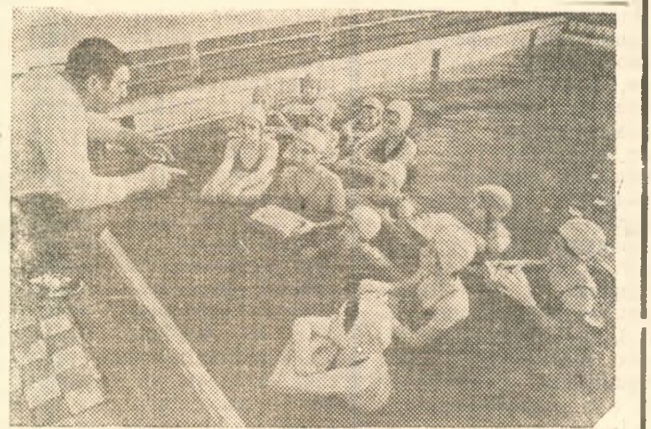
Урок в школьном бассейне.