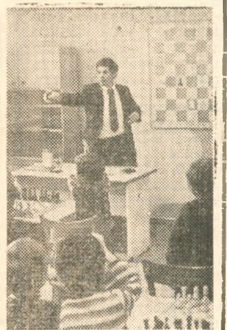
Челябинск. Занятия в школе юных шахматистов.