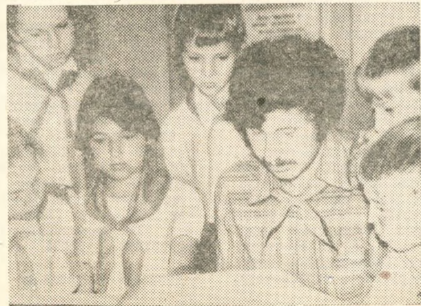
«Нашли общий язык».

Надеемся, что и в школе, став учителями, наши студенты покажут себя умелыми, грамотными специалистами, мастерами своего дела; сумеют на практике применить теоретические знания, умения и навыки, полученные в институте. Быть достойными высокого звания «советский учитель» — почетная и ответственная задача!