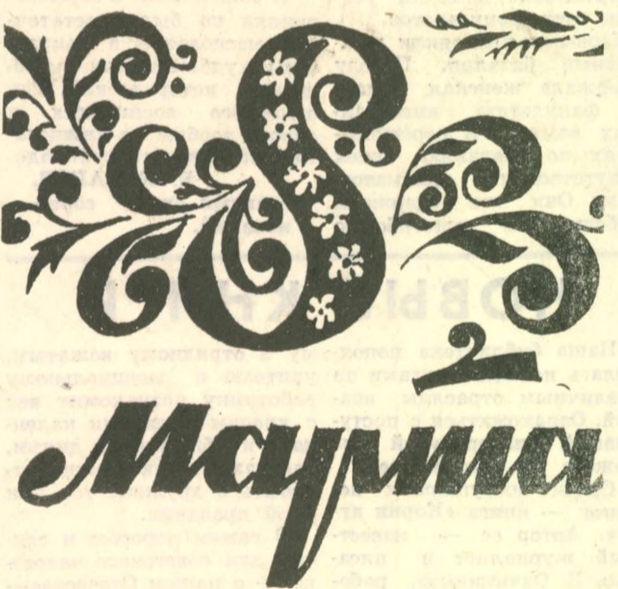
Рисунок Г. Найко.