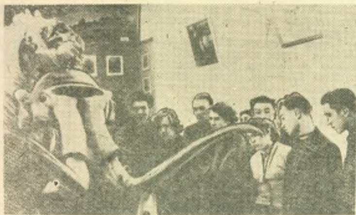
Студенты факультета ФВиС на экскурсии в краеведческом музее.

Осенью прошлого года мне посчастливилось походить с опытным искателем женьшеня и найти самому несколько корней этого замечательного растения.