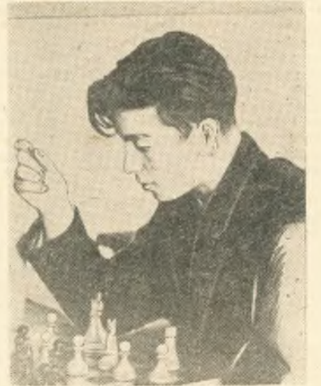
За обдумыванием хода.