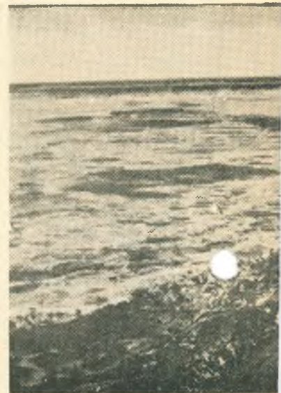
Ледоход на Амуре.

Т. Я. СИЗЫХ, ответственный дежурный по штабу.