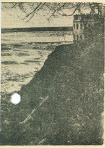
Фотоэтиюд Г. Самара.